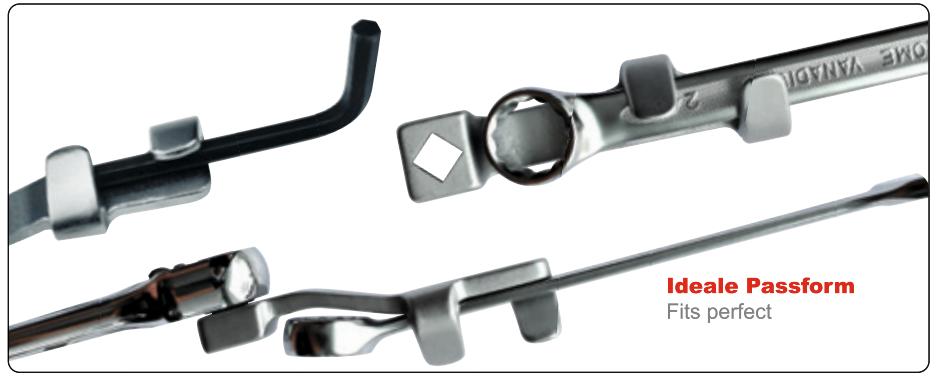
Ideale Passform Fits perfect