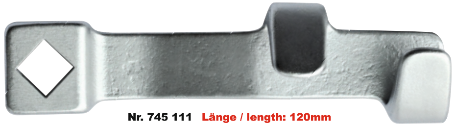
Nr. 745 111 Länge / length: 120mm SW13-24 / 13-24mm

To loosen tight connection of hex, TX + XZN